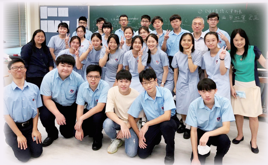
陪伴學生健康成長是羅老師（中排右一）在教學生涯中最想做的事情

羅老師喜好繁多，如：看書、與知己聊天、品嚐各種美食等。而她最喜愛的食物是螃蟹，她笑言只要是螃蟹，不論品種，她都喜歡吃。除了以上興趣外，她認為自己持續最久的興趣是教學和看電影。她熱愛這兩樣興趣，全出於她對人的好奇和熱愛。她說：「教學一直能讓我從中獲得最大的滿足感，它能令我樂而忘憂，不知老之將至。」在三十七年的教學生涯中，令她能堅持下去的最大動力是看到學生健康成長，這是對她最好的回報；而她亦深信，自己在教學上真誠的付出，日後必能「利息滿天下」！