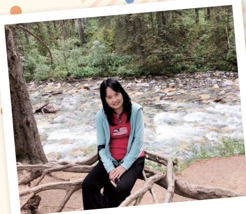
「雲淡風輕，歲月靜好。」是羅老師對自己退休生活的祝願。

退休後的羅老師回歸到真正的自己，做自己喜歡的事情，過自己想過的生活，嘗試接受新的事物和挑戰，令生活更豐富多姿。雲淡風輕、歲月靜好是羅老師對自己退休生活的祝願。她分享到有一次黃昏在屋苑散步時，偶爾想起楊絳老師在《百歲感言》結尾有這樣的一段話：「人生最妙曼的風景，是內心一份從容與淡定。」她希望在往後的日子裏也能擁有這道人間風景，就像看著黃昏的夕陽，淡定又讓人感到安穩。