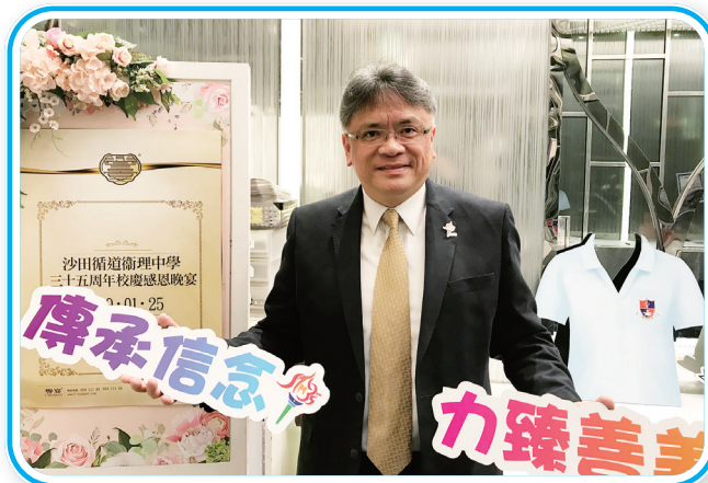
鄧老師衷心寄語同學不負時光，亦不負自己。

最後，鄧老師衷心希望同學能夠好好珍惜一去不返的青葱歲月，不負時光，亦不負自己，要勇於嘗試。同時，他也盼望同學能永遠抱著積極的態度去面對人生，雖然人生有很多挫折，但鄧老師認為不要緊，只要積極面對困難、盡快收拾心情繼續前行就可以了。還有我們要熱愛生命、常存感恩之心，愛己及人，就如昔日的同學會關心鄧老師的身體狀況。鄧老師最後亦期望同學能多認識主耶穌基督，正如《聖經》傳道書所說：「你趁着年幼，衰敗的日子尚未來到，當記念造你的主。」這都是鄧老師對同學們的寄語，以及對信仰的追求。