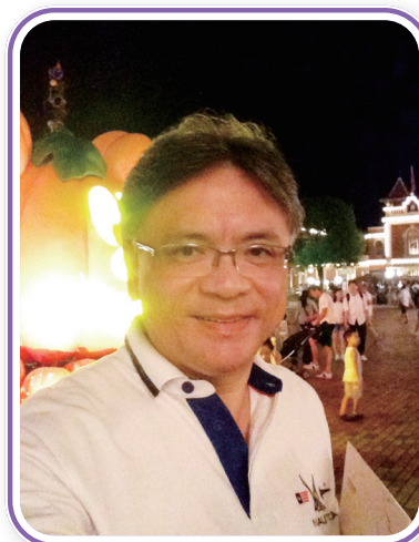
鄧老師盼望同學熱愛生命，常存感恩之心。

令鄧老師堅持教學熱誠，除了是高中的老師留給他的榜樣，沙循同學積極學習的態度和對他的關懷愛戴同樣重要。上課時同學們積極回答他的問題，讓鄧老師感到同學都十分欣賞他的教學，這也是令他保持教學熱誠的關鍵。在鄧老師病倒的時候，同學都會慰問他：「是不是不舒服？」、「需不需要再休息多一會？」聽到鄧老師聲音沙啞的時候，同學也會送水給他，令他感動不已。歷年的生日、聖誕節等重要日子，鄧老師都收到同學親手製作的祝福，例如心意卡、摺紙等等，這些禮物都是用錢買不到的，種種片段都令鄧老師感到窩心，回憶起來也十分感動。這些事情都印證了「教學相長」的理念，亦成為了鄧老師堅持教學的動力。