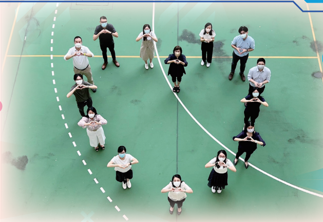
老師們排列成愛心形狀，表現沙循教職員的溫暖與融洽。